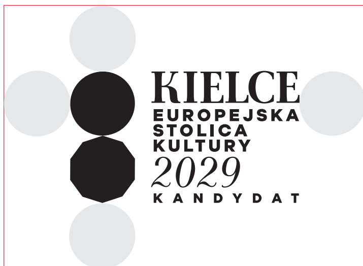
logo na apli