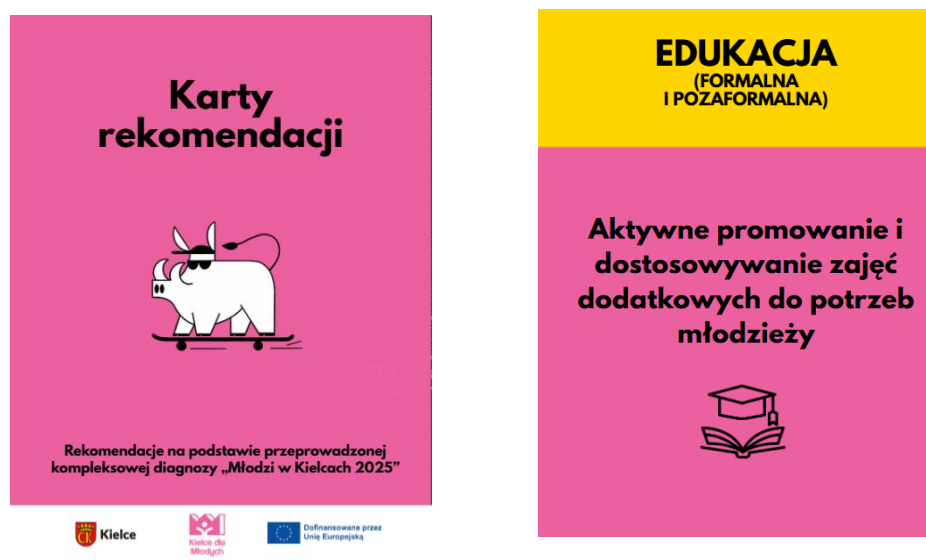
Rys. 1.2. Przykładowe karty rekomendacji.

Ważną rolę podczas wszystkich spotkań odgrywali przedstawiciele Młodzieżowej Rady Miasta Kielce, którzy nie tylko uczestniczyli w pracach grup, lecz także moderowali dyskusje, wspierali uczestników w doprecyzowaniu zgłaszanych idei oraz pomagali w formułowaniu pomysłów w sposób możliwy do późniejszego przedstawienia władzom miasta. Ich obecność wzmacniała charakter procesu jako działania prowadzonego „z młodymi i dla młodych”, a jednocześnie umożliwiało bieżące budowanie kompetencji liderских i konsultacyjnych wśród członków Rady.